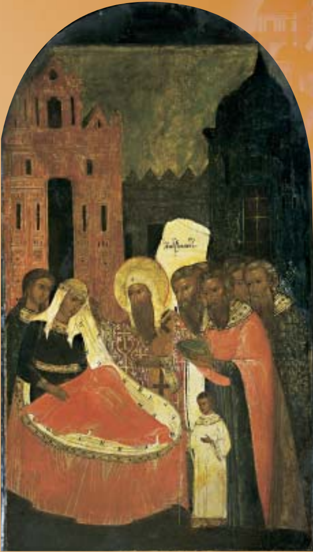
благо земного Отечества и во славу Божию. Почитание святителя Алексея ширилось и распространялось не только среди православных, но даже